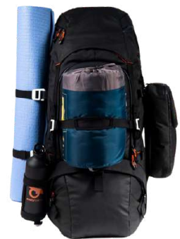
Ensembles de sangles