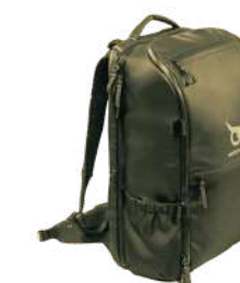
Sac 30L Kaki S322KAK