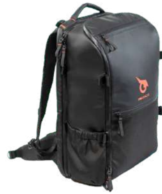
Sac 30L multifonctions