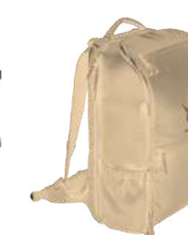
Sac 30L Beige S322BEI