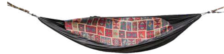
Hamac-Poncho 3 en 1