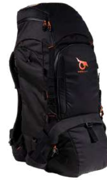
Sac à dos modulable 50L